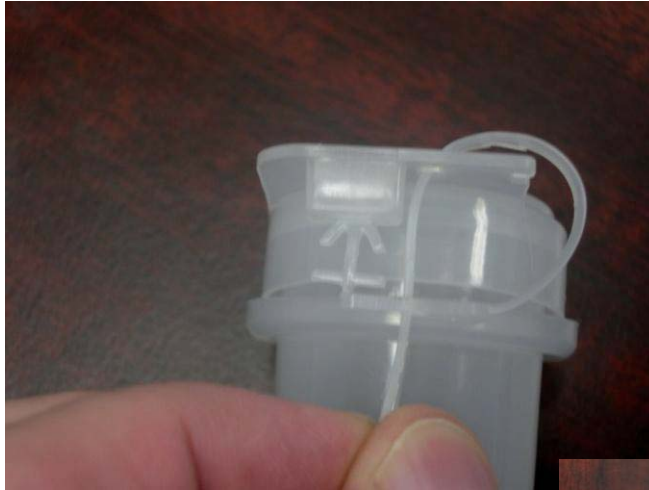
2 oz Vial de Custodia